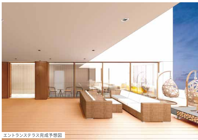
エントランステラス完成予想図

相模湾を眼下に望む自然豊かな高台に、和の美意識を踏襲したラグジュアリーホテル「ISHINOYA 熱海」が、いよいよグランドオープン。市街地の喧騒を離れた閑静な住環境で快適なひとときをお過ごしいただけるよう、ご滞在をサポートいたします。