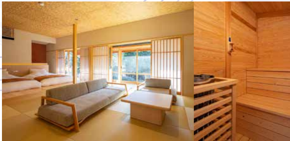
サウナ温泉露天付スイートツインルーム / 1階 [清水]