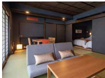
温泉付セミスイートツインルーム / 2階 [唐津]