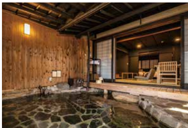
温泉露天付(岩風呂) スイートツインルーム / 1階 [有田]