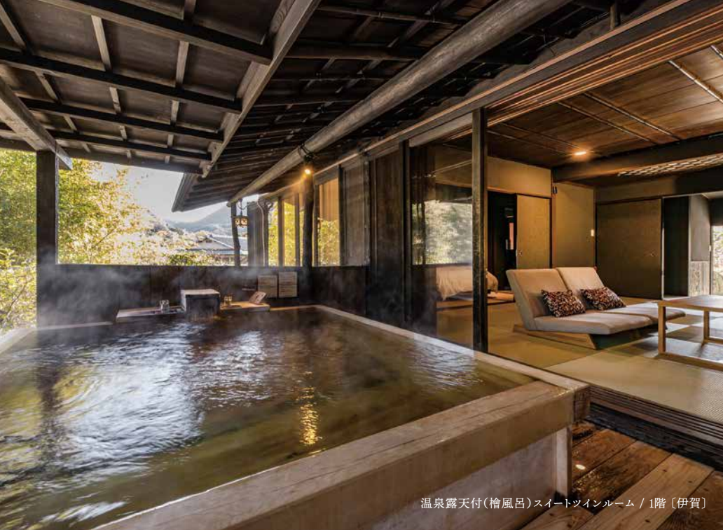
温泉露天付(檜風呂)スイートツインルーム / 1階 [伊賀]