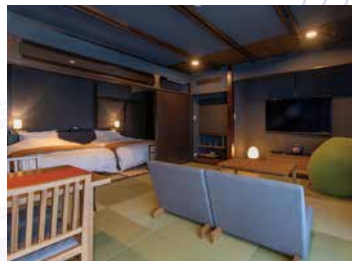
温泉付セミスイートツインルーム / 3階 [相馬]