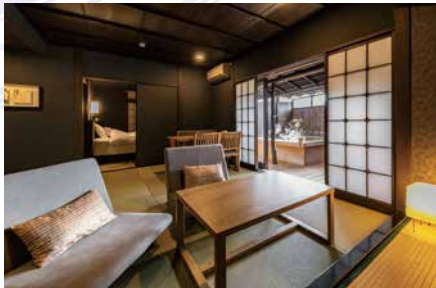
温泉露天付(檜風呂)スイートダブルルーム / 1階 [会津]