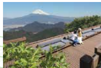
伊豆の国パノラマパーク