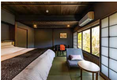
温泉付スーペリアダブルルーム / 2階 [九谷]