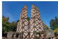
世界遺産 富士山反射炉